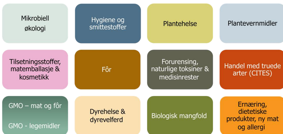
Figur 1 Fagområdene i VKM

I VKM sine vedtekter §3 Funksjoner, spesifiseres det hvilke fagområder som omfattes av VKM sitt mandat og hvilket direktorat som har forvaltningsansvar. Fagområdene gjenspeiles i stor grad i faggruppene. Figuren under viser fagområdene VKM dekker i dag.